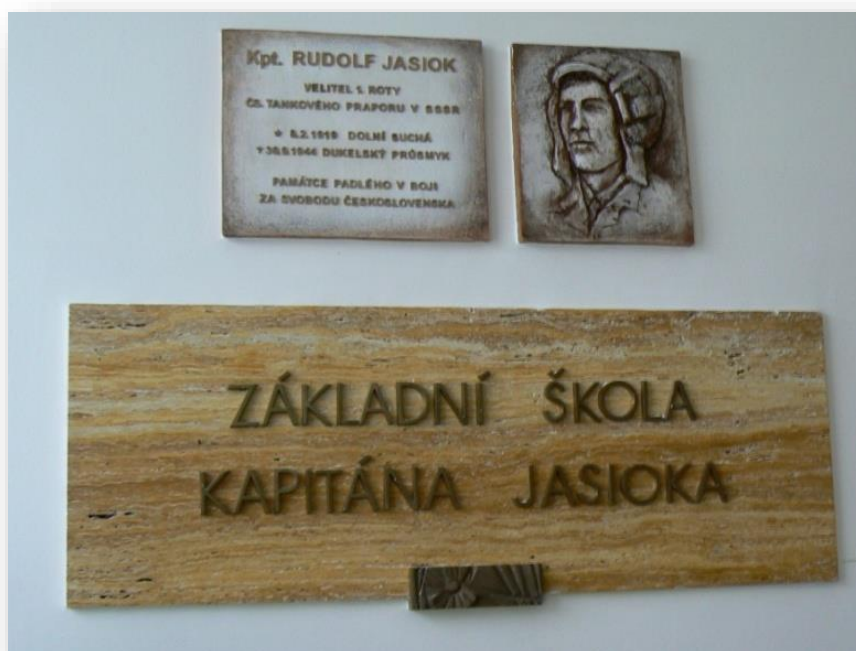
Pamětní deska ve vestibulu školy